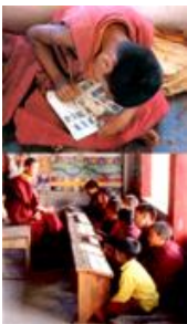
Zie Afbeelding 26: Jonge monnik uit Tibet leert schrijven / Jonge monniken uit Nepal krijgen les.

(Vergelijk met het 'feest' van het vormsel of de plechtige communie voor christenen of het 'lentefeest' voor vrijzinnigen bij ons. Mooie kleren horen erbij!)